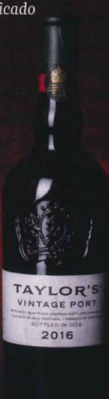
2º vinho fortificado