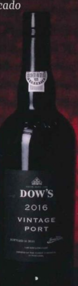
1º vinho fortificado