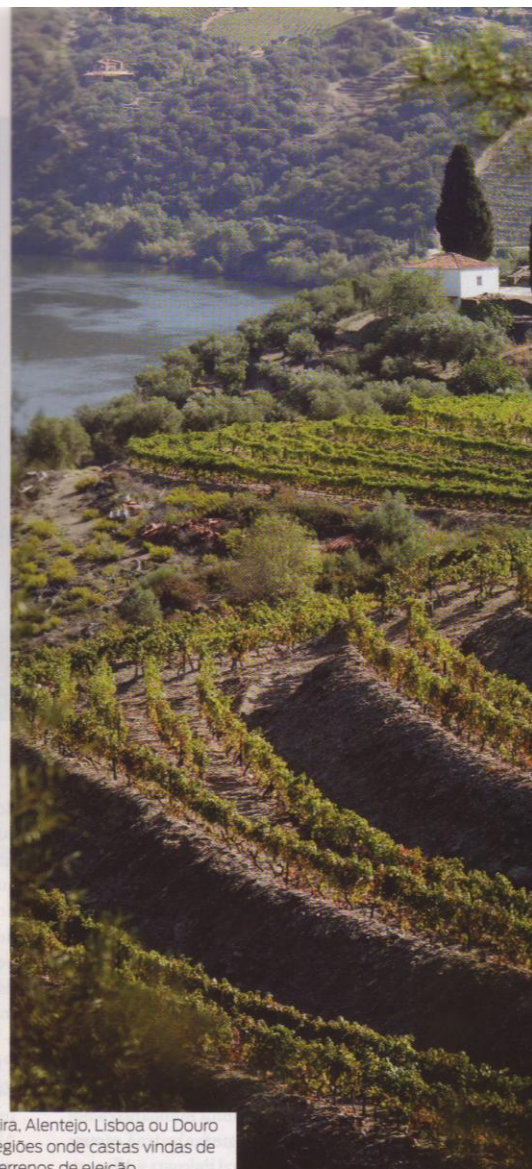
Adaptação: Madeira, Alentejo, Lisboa ou Douro são exemplos de regiões onde castas vindas de fora encontraram terrenos de eleição

fundos, com boa camada freática e bastante humidade favorecem a boa maturação das uvas, que só acontece com bastante grau alcoólico. Os aromas inicialmente herbáceos são agora florais, mas sem excessos, e os frutos silvestres como amoras e mirtilos são os traços fortes do vinho. Na boca o vinho é sedutor, com bom volume de entrada e corpo redondo. Desde 2005 que o Petit Verdot compõe 15% a 20% do Dona Maria Reserva e o varietal estreme a 100% mostra uma maturação e qualidade que nunca tinham sido conseguidos na França de origem. A casta está, pouco a pouco, a alastrar dentro do Alentejo e também para o Ribatejo ou a Bairrada.